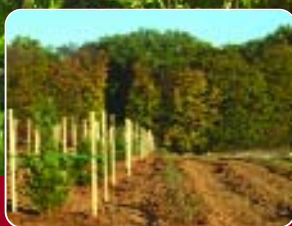
Hecken als Lebens- raum für Wildtiere