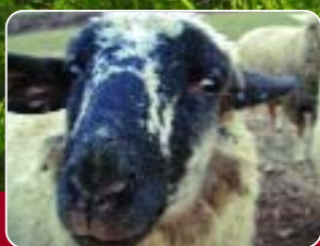
Ein neuer Bewohner des Gnadenlands