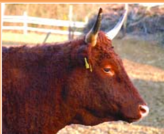
Hemweh kümmert sich um die jüngeren Kühe wie eine Mutter

Auf dem Gnadenland hat er sich sehr schnell gut eingelebt. Michel ist übrigens alles andere als »bösaartig«. Er hat einen sehr edlen Charakter, ist feinfühlig, ganz sanft, ist nie wild, wie man es den Stieren nachsagt, sondern ist ein richtiger Gentleman.