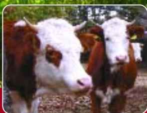
Großfamilie vor dem Schlächter gerettet