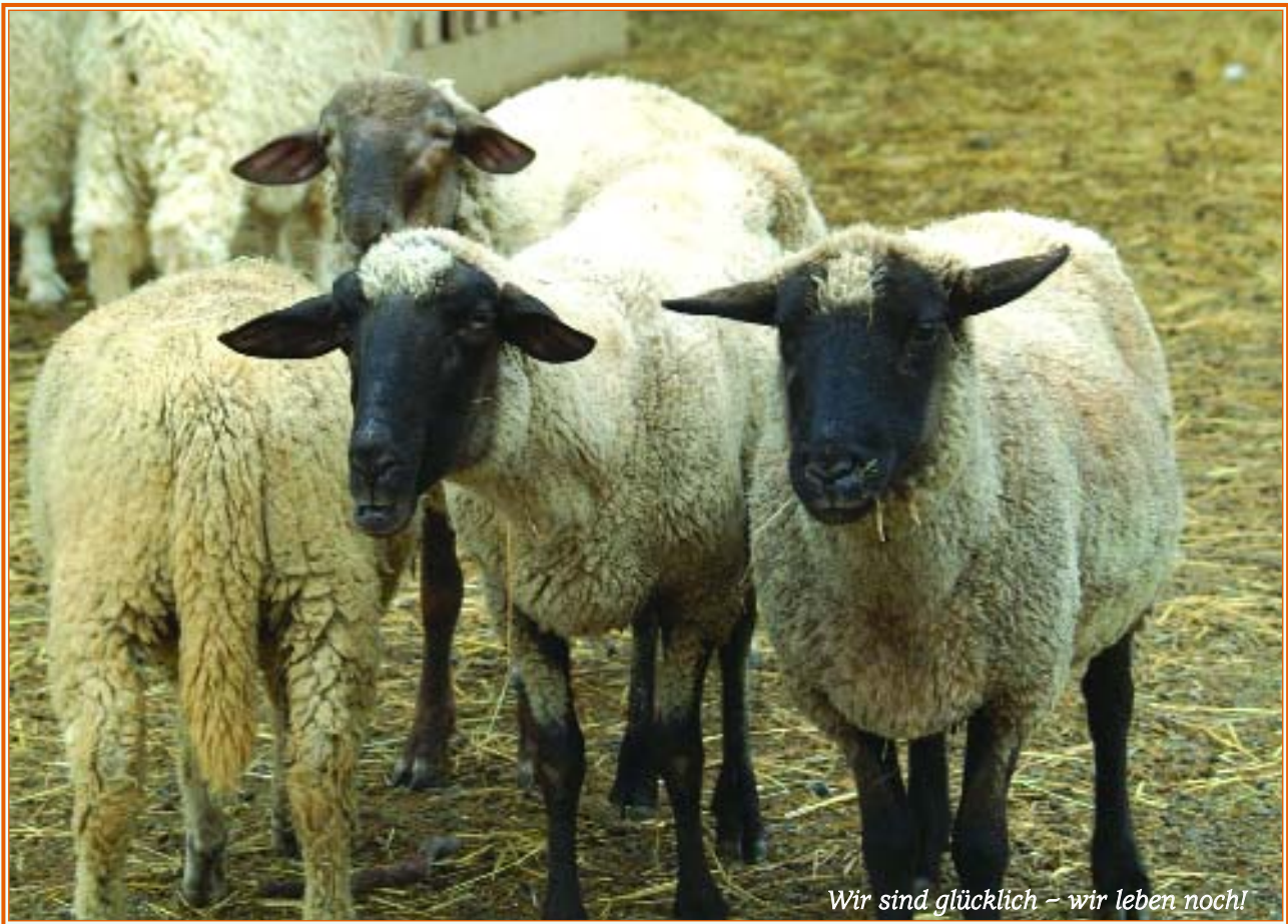
Wir sind glücklich – wir leben noch!

M it uns Tierbetreuern der Gabriele-Stiftung haben sich die zwanzig wolligen Schafe schon gut angefreundet. Besonders anhänglich sind sie natürlich, wenn Essenszeit angesagt ist. Wenn ich mir nichts einfallen lasse, überrennen sie mich fast, und ich komme gar nicht an die Futtertröge ran. Ich muss mir jeden Tag etwas Neues einfallen lassen. Manchmal schleiche ich mich auf ganz leisen Sohlen in den Stall, damit sie nichts merken