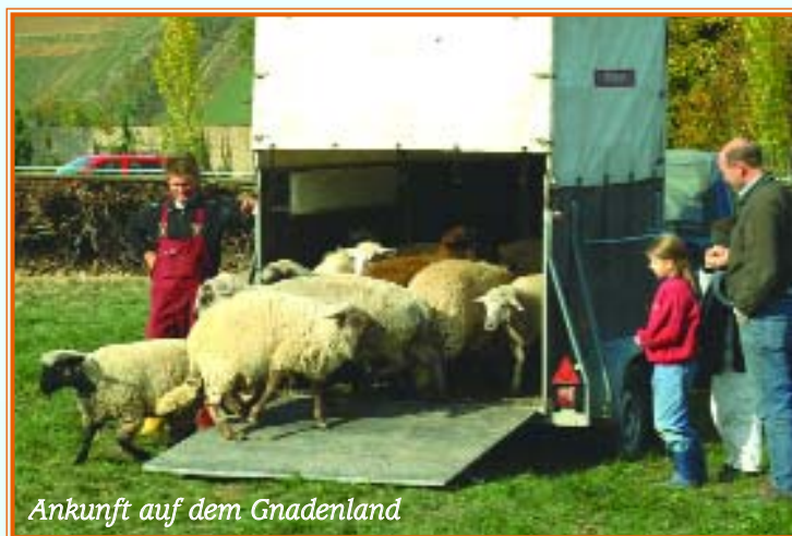
Ankunft auf dem Gnadenland

E s war für alle eine große Freude, als der Schafstall fertiggestellt war und die kleine Schafherde endlich auf das Gnadenland der Gabriele-Stiftung umsiedeln konnte. Einige Tiere machten bei der Ankunft auf ihrer neuen Weide richtige Freudenstrünge über das Gras. Andere fingen sofort an, genüsslich an den feinen Kräutern zu knabbern. Wieder andere blieben ganz still stehen und lenkten ihren Blick in die Ferne über das friedfertige Land, als ahnten sie, auf welch besonderem Boden sie Heimat gefunden hatten.