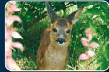
Un corcino es rescatado