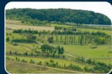
Setos en el sistema de biotopos conectados entre sí