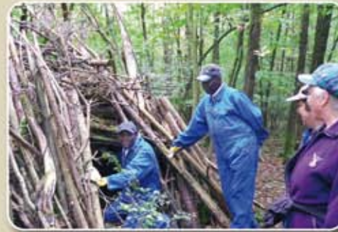
Construcción de un iglú de troncos y ramas para los corzos del bosque.

GABRIELE IAL O EL MUNDO AL PRÓJIMO Y LOS ANIMALES