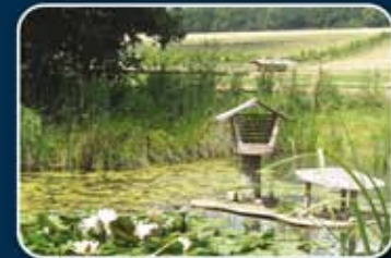
Se construye un biotopo húmedo