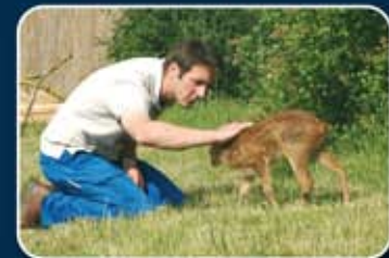
Los animales ganan confianza