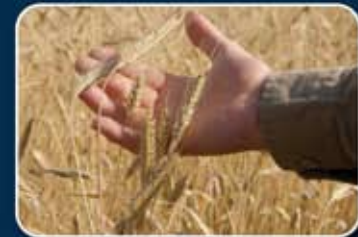
El cultivo pacífico de la tierra