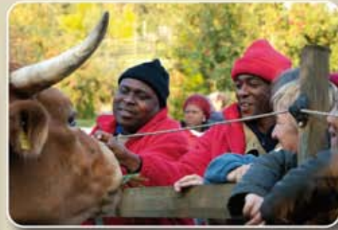
Cara a cara con los animales.