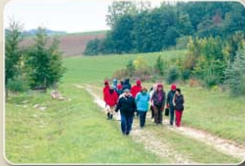
Miembros del Consejo internacional, visitan el sistema de biotopos conectados entre sí.